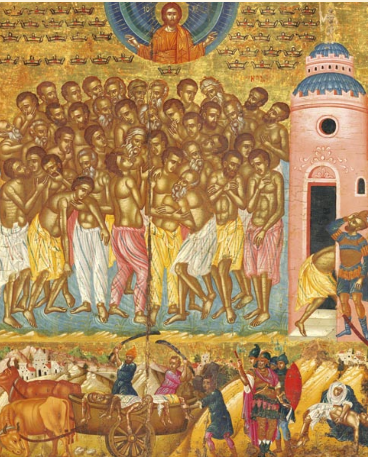
Τό μαρτύριο τῶν ἁγίων Σαράντα μαρτύρων.