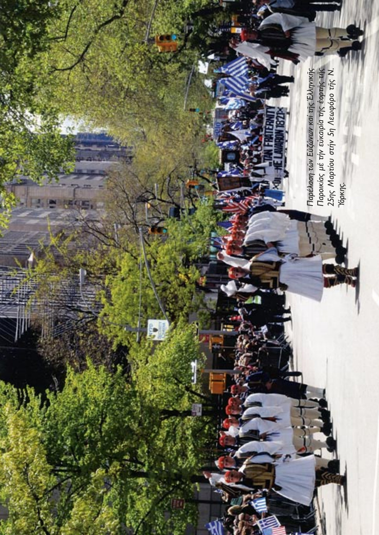
Παρέλαση τῶν Εὐζώνων καί τῆς Ἑλληνικῆς Παροικίας μέ τήν ευκαιρία τῆς ἑορτῆς τῆς 25ης Μαρτίου στήν 5η Λεωφόρο τῆς Ν. Ἰόρκης.