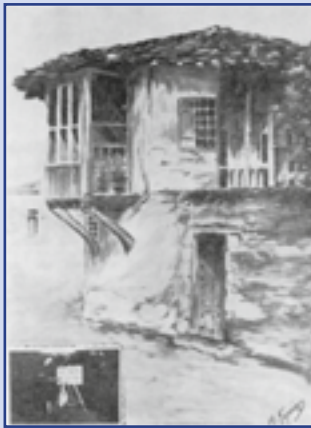
Ή οικία πού έγεννήθη ό Γεώργιος Λασσάνης όπως τήν έφιλοτέχνησε ή άείμνηστη ζωγράφος Μαριγούλα Γερούκη, τό έτος 1950.

Ό Γεώργιος Λασσάνης δέν τήν άντεχε τή σκλαβιά. Γι' αυτό καί πολύ γρήγορα βρέθηκε κλέφτης στόν Όλυμπο, κοντά στόν μπάρμπα του, τόν Πρασινονικόλα. Όταν όμως ό Άλη-Πασάς, τό 1813, άποφάσισε νά χαλάσει τήν Κλεφτουριά, άφησε τό μεγάλο βουνό, κατέβηκε στήν